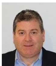
Emmanuel CHANUT, Maire

Les nouveaux élus municipaux sont entrés en fonction lundi 18 mai 2020 et le premier conseil municipal a eu lieu le 25 mai 2020, permettant l'élection du Maire. Qui sont-ils, que font-ils ?