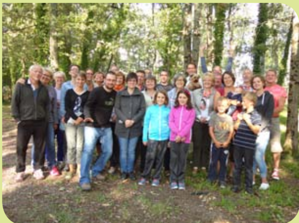
Quartier rue des Tilleuls, Forterres et Saules