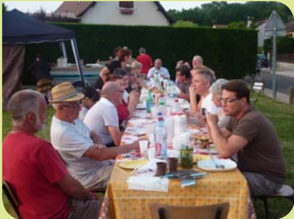
Quartier rues des Saules, Charmilles et Pommerelles.