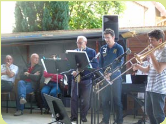
Quartier des voisins de la rue de la Grappe