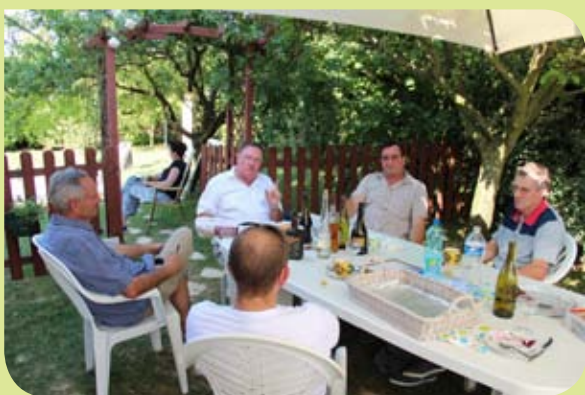
Voisins de la rue de la Taille